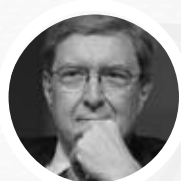
Enrico Giovannini Sostenibilità già Ministro MIMS